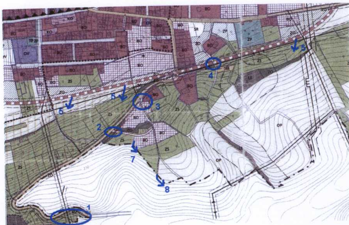
Identifikované problémy propojení

ÚP Smečna nenavrhuje územní provázání s obcí Svinařov, hlavně dopady na navazující dopravní infrastrukturu a retenci dešťových vod z jižní části Smečna a z nového obchvatu.