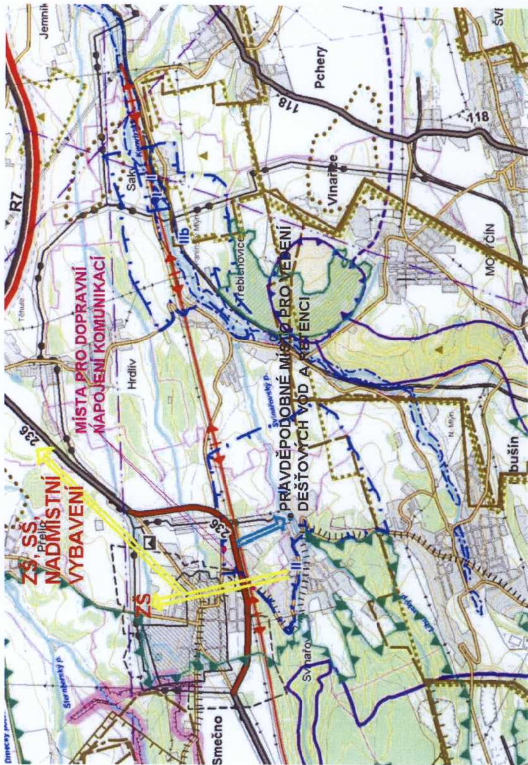
schéma z ákres do kopie ni. výkresu ÚP VÚC Pražský region